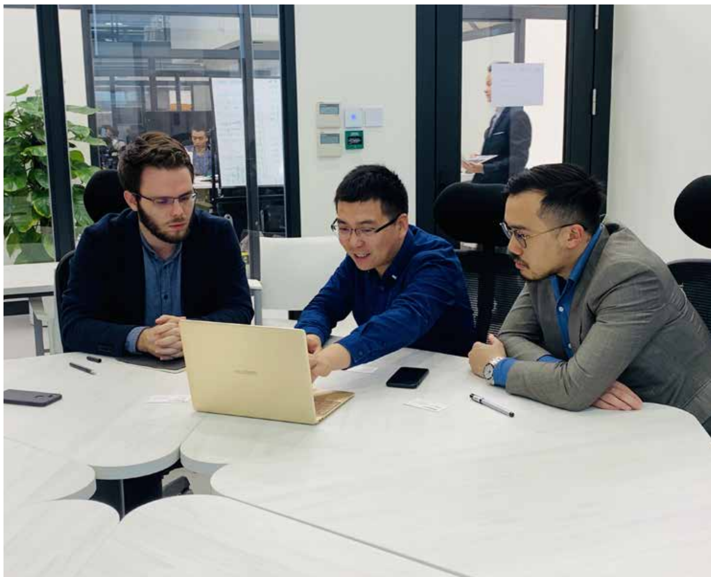
線上創業培訓、自動售賣機、數字銷售和物流業在疫情期間「生意興隆」 Start-ups de educação através da Internet, máquinas de vendas automáticas, marketing digital e logística têm tido sucesso durante a pandemia

孵化中心已經協助搭建三個外賣平台。其中一個是上週在美國成功上市的「澳覓」，目前已獲上市公司450萬美元（約361萬澳門元）作為流動資金。徐美珊表示，大部分的企業家都很有「野心」，他們已經想把業務擴展到周邊城市。「疫情讓更多的人主動出擊，而不是坐等遊客的到來」。