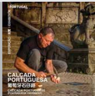
「葡萄牙石仔路」展覽 2026年6月22日至7月22日 塔石玻璃屋

Exposição “Calçada Portuguesa” 2026/06/22 - 2026/07/22 Casa de Vidro, Tap Siac