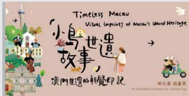
「小島世遺故事」澳門世遺的視覺印記——郝元春插畫展 2026年04月02日至08月28日 澳門旅遊塔會展娛樂中心T1藝言匯畫廊

Exposição “Calçada Portuguesa” 2026/06/22 - 2026/07/22 Casa de Vidro, Tap Siac